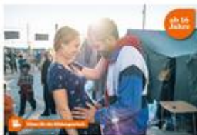
Rafaël – eine Liebesgeschichte in Zeiten von Flucht und Migration

„Brot für die Welt“ hat zum Film „Rafaël“ ein Begleitmaterial herausgegeben. Der Spielfilm erzählt von der gefährlichen und illegalen Flucht über das Mittelmeer und beruht auf einer wahren Begebenheit. Der Tunesier Nazir versucht seine Frau Kimmy in die Niederlande zu folgen. Mit dem Schlauchboot flieht er über das Mittelmeer und landet auf Lampedusa. Von dort beginnt ein ungewisses Leben in Flüchtlingslagern. Herzstück des Begleitmaterials ist das Planspiel „Watch The Sea“ und gibt Anregungen zum Nachdenken über Fluchtursachen und Fluchtwege. Die Lebensbedingungen in Flüchtlingslagern sowie